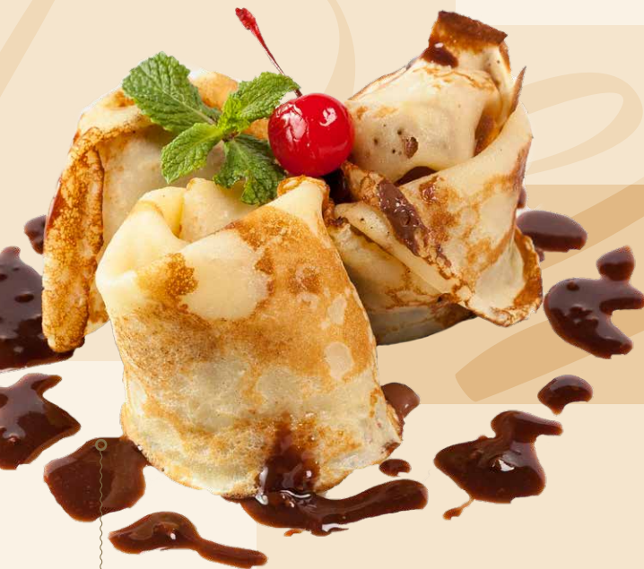
PALACINKY S NUTELLOU (1,3,7) domácou šľahačkou a čokoládovým toppingom CREPES WITH NUTELLA homemade whipped cream and chocolate topping