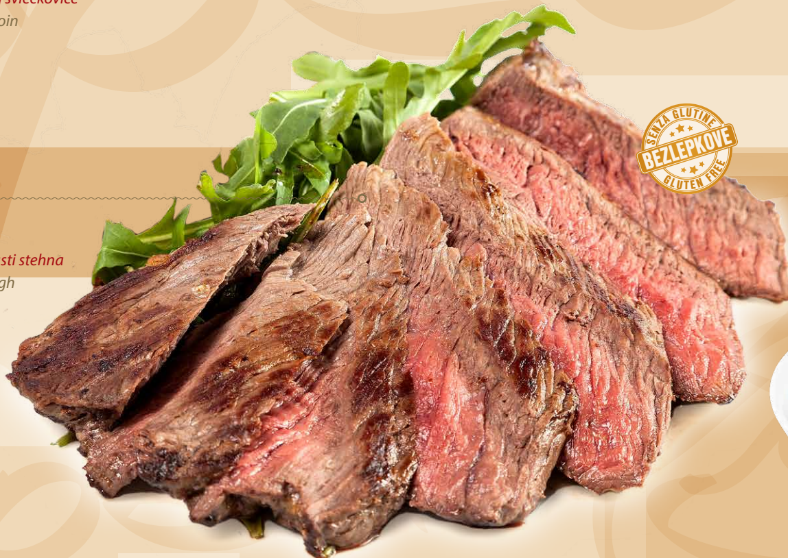
RUMP STEAK (7) šťavnatý hovädzí steak z hornej časti stehna juicy beef steak from the upper thigh