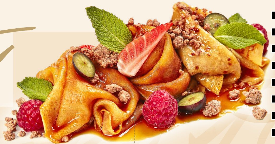
PALACINKA CREPES SUZETTE (1,3,7) s pomarančovým karamelom, čerstvým ovocím a jedlou hlinou z čokolády with orange caramel, fresh fruit and chocolate clay