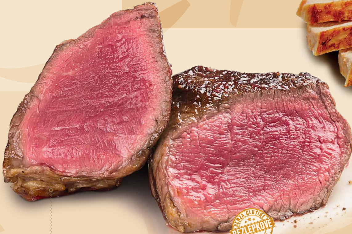
FILET MIGNON (7) šťavnatý hovädzí steak z pravej sviečkovice beef steak made of original sirloin